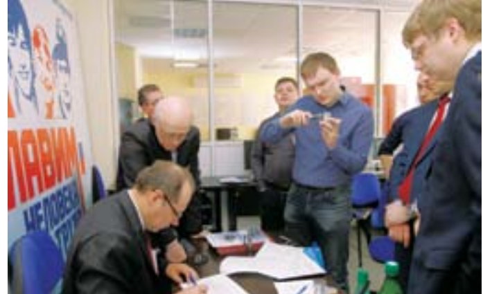
Центр ДПО ПАО «МЗИК» благодаря уникальному техническому оснащению стал площадкой не только для обучения практически всем рабочим специализации, но и для проведения семинаров, конференций, профессиональных конкурсов заводского, городского и регионального масштабов

алистов завода. Также они отводят время на проведение обязательной аттестации персонала и курируют обучение каленинцев в вузах по направлению от предприятия.