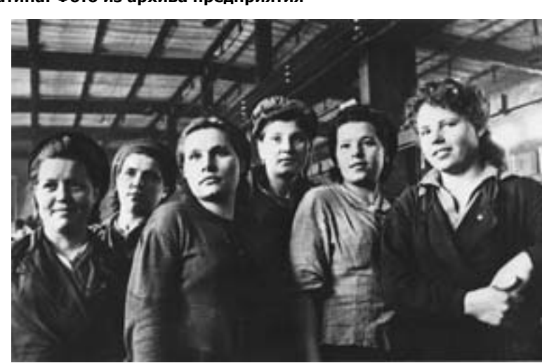
Фронтая комсомольско-молодежная бригада цеха 3, 1944 г.

Девочки и мальчишки были неопытные, большинство вперые пришли на завод. Их нужно было учить, а времени на это не было. Кадровые рабочие брали шефство над молодежью, открывались кружки техминимума. Было решено организовать бри-