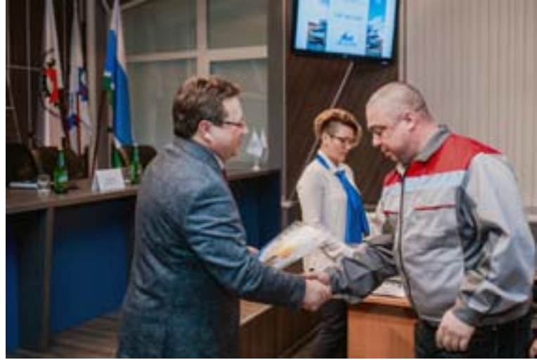
Вручение свидетельств о присвоение классных званий - многолетняя традиция слета мастеров

и чувство патриотизма работников, повышать авторитет мастеров; организовывать обмен опытом как внутри ЗИКа, так и за его пределами.