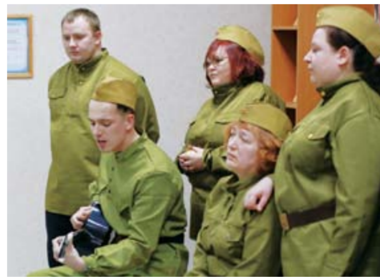
И стихи, и песни, и брейк-данс включила в себя композиция цеха 82 «Ах, война, что ты сделала, подлая»