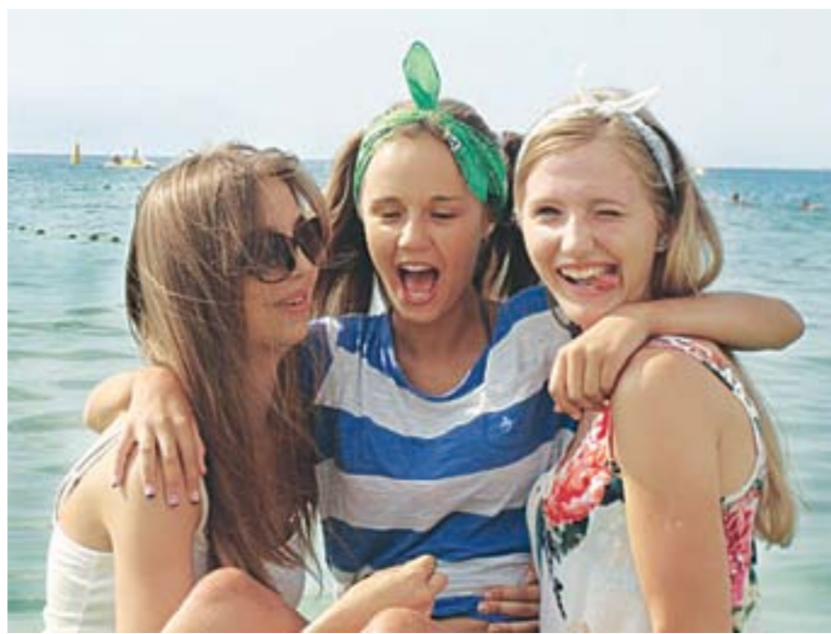
Схема предоставления путевок в южные санатории останется прежней.

На данный момент авиабилеты на юг уже забронированы: 100 детей отдохнет у моря во вторую смену, еще 75 - в третью. Возраст путешественников - от 9 до 14 лет включительно. Ребята обязательно будут сопровождать взрослые, в том числе медицинские работники. Кстати, предприятие позаботилось и о трансфере в аэропорт: специальный автобус будет забирать группу детей с сопровождающими от здания СПСЧ №1 и сюда же доставлять после отдыха.