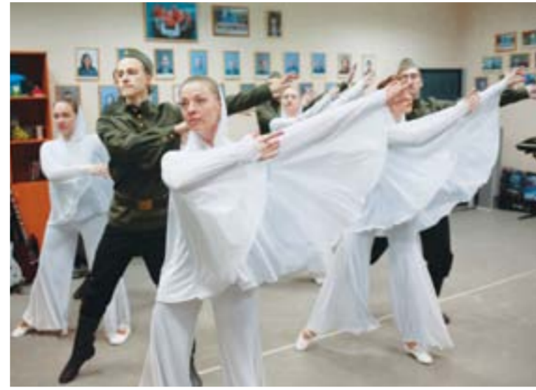
Пронзительный, тонкий, парящий номер под песню «Журавли» в исполнении Марка Бернеса