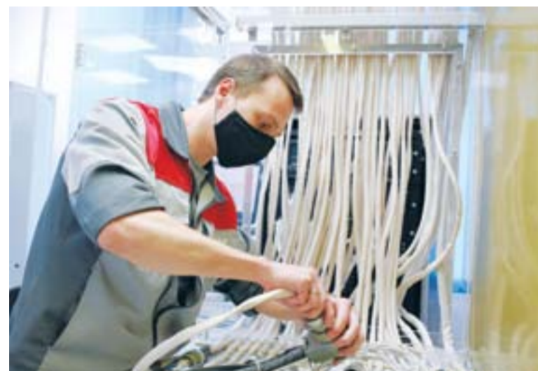
Используемые на монтажных участках цехов 30 и 35 высококачественные, высокотехнологичные, высокоточные автоматизированные системы контроля монтажа по своим характеристикам обгоняют западные аналоги