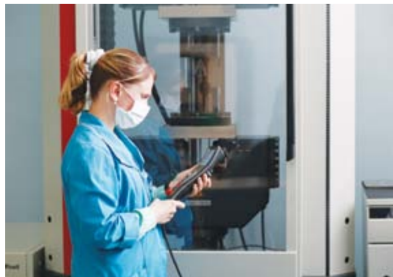
По техническому оснащению механическая лаборатория отдела 68 - передовая в Свердловской области. Если проводить аналогию с автомобилем, то оборудование, которое там внедрено, можно сравнить по уровню с машиной «Мерседес»

радиофака, и совершенно не важно, есть ли у него диплом метролога.