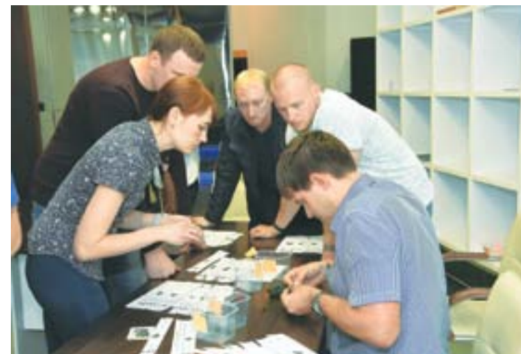
Для каждого резервиста будет сформирован индивидуальный план развития с использованием корпоративного обучения, наставничества, стажировки, оценки, игровых методов

ляют отбор кандидатов, соответствующих требованиям целевой должности.