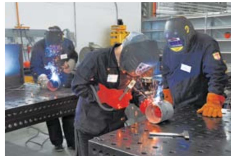
Расширятся источники наполнения кадрового резерва: теперь в него будут вноситься победители профессиональных конкурсов, а также работники с активной жизненной позицией и профессиональным потенциалом

Работники оповещаются о запуске программы, знакомятся с документами о программе и условиях конкурса. Сотрудники отдела по работе с персоналом анализируют поступающие данные о кандидатах, осуществ-