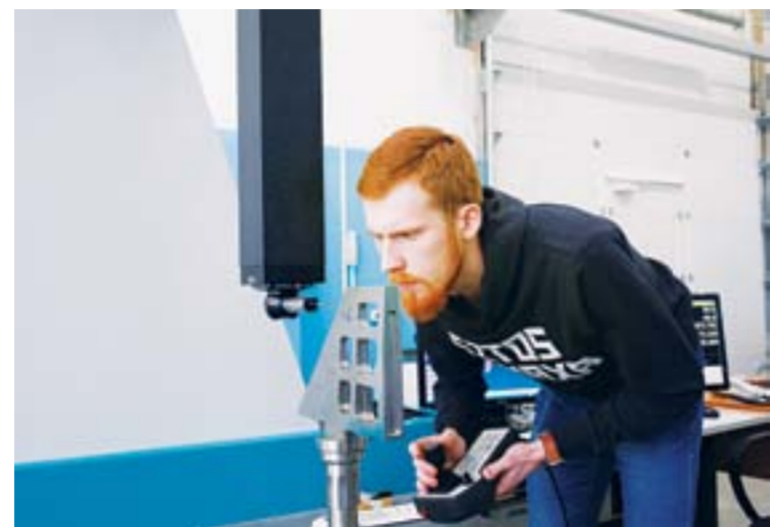
Несколько лет назад для метрологов приобрели координатно-измерительную машину, в скором времени аналогичное оборудование поступит в цехи 37 и 96

Самая актуальная проблема в том, что вузы готовят специалистов, не понимая, какие компетенции требуются сейчас для сотрудников предприятий, какие задачи стоят