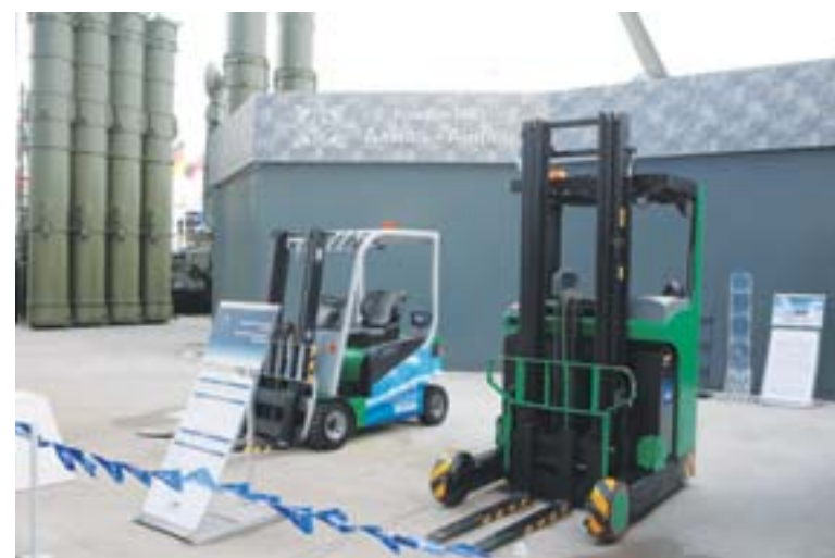
Свои достижения ПАО «МЗИК» демонстрировало и в области гражданского производства

ции. Наш завод вошел в топ-10 рейтинга «Лидерство на гражданских рынках» как предприятие с высоким уровнем организации производства продукции гражданского направления. - Церемония награждения