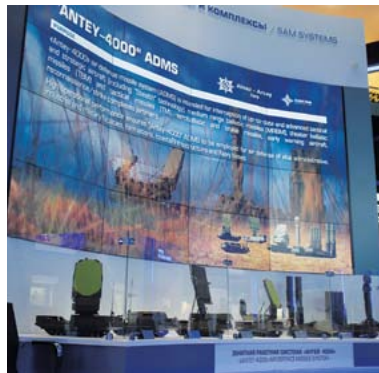
В демоцентре Концерна интерактивная презентация ЗРК «Антей-4000» занимала центральное место