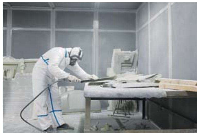
Для обточки деталей из композиционных материалов на участке оборудована специальная камера с отличной вентиляцией и шумоизоляцией. Находиться в ней можно только в специальном защитном костюме и маске

Участок, где организован полный цикл производства композиционных материалов, занимает порядка 1000 квадратных метров, здесь создано 16 рабочих мест. Оборудование - самое современное и высокопроизводительное. Возьмем, к примеру, раскройный стэнд - универсальный промышленный плоттер с большими возможностями для резки изделий любой сложности из различных материалов. При компактных размерах он обладает высокой скоростью работы и качеством раскроя. Для вакуумного формирования предназначен вакуумный стол; для термических режимов - новые печи, в которых «готовятся» детали. Благодаря автоматическому контролю температуры и времени