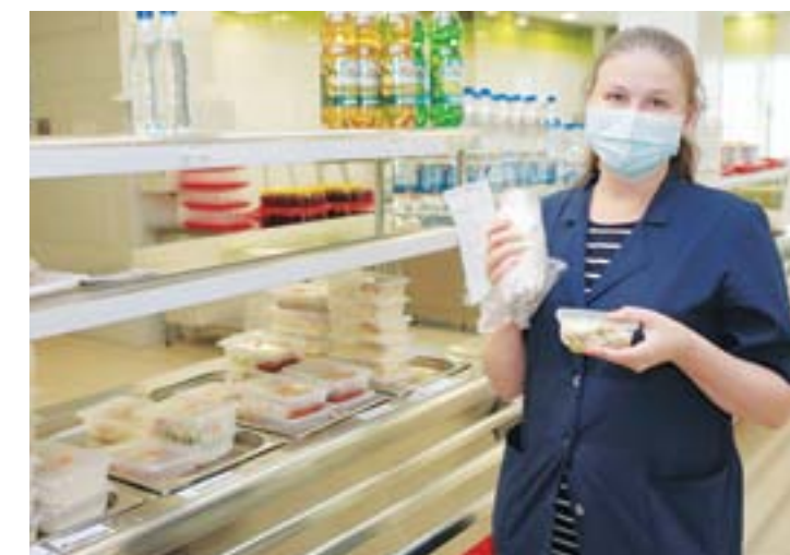
Необычный для калининского общепита фастфуд появился в столовой №24. Новинка пришлась заводчанам по вкусу

сезона свежих овощей. Сегодня посетителям предлагают несколько вариантов салатов, гарниры из кабачков, баклажанов, брокколи, цветной капусты, а также витаминизированные компоты и морсы из натуральных ягод.