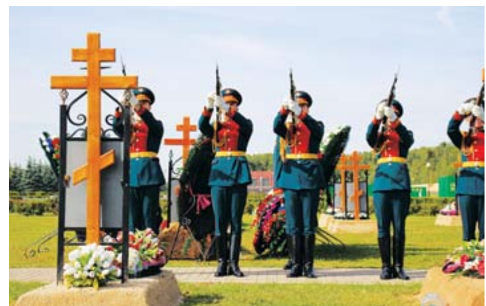
Прах выдающегося конструктора был перезахоронен с воинскими почестями на Федеральном военном мемориальном кладбище Минобороны России

вого класса, чьи зенитные автоматы считались непреодолимыми. После испытаний и доводок пушка была принята на вооружение в 1939 году, однако вскоре специалисты ГАУ сочли калибр 45мм слишком большим для полевых зенитных автоматов, и предпочтение было отдано 37мм пушкам, их проект в КБ Завода №8 возник в ходе доработок 49-К.