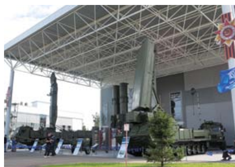
Еще одна премьера форума - разработанная калининскими конструкторами пусковая установка 51П6Е2, которая войдет в состав перспективного комплекса нестратегической противоракетной обороны

На форуме также были объявлены итоги первого в России масштабного исследования уровня диверсификации организаций ОПК. В ходе совместного проекта специалисты компании «Иннопрактика» и Промсвязьбанка