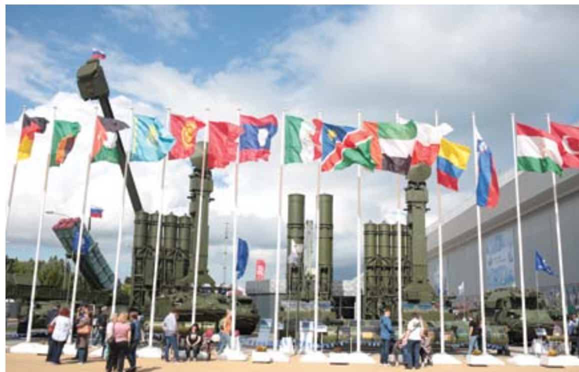
Центром внимания многочисленных иностранных делегаций, российских и зарубежных средств массовой информации стал калининский «Антей-4000»

Текст: Наталья Заплата. Фото: Сергей Лыхин