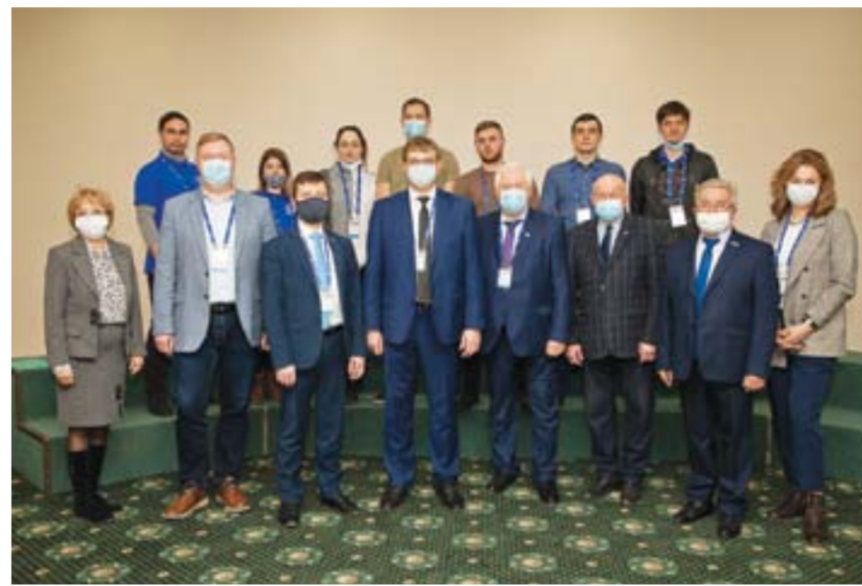
В Форуме рабочей молодежи «Машиностроители Урала» приняли участие руководители департаментов региональных министерств и администрации Екатеринбурга, кафедр Уральского федерального университета, а также предприятий и организаций ОПК

Текст: Наталья Заплата.