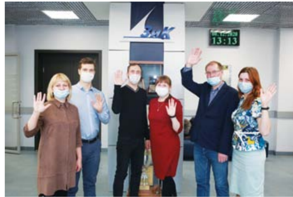
Во многих коллективах произошла смена председателей цеховых первичек, причем во многих случаях выбор был сделан в пользу молодых сотрудников

В ноябре начинающие председатели и члены профактива цехов и отделов прошли обучение в ФПСО. Общественным активистам рассказали о коллектив-