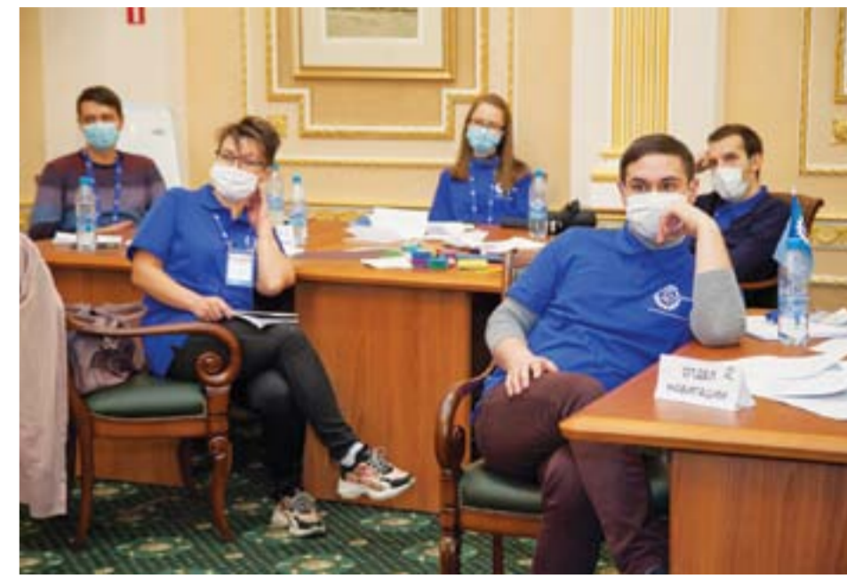
По условиям конкурса командам необходимо было сформировать стратегию спасения своего космического шаттла, ориентируясь на принципы рационального использования ресурсов, оптимизацию промежуточных процессов, применение инструментов бережливого производства

Все участники форума были распределены по разным командам, так что по ходу игры мы познакомились и сразу распределяли роли, генерировали идеи и