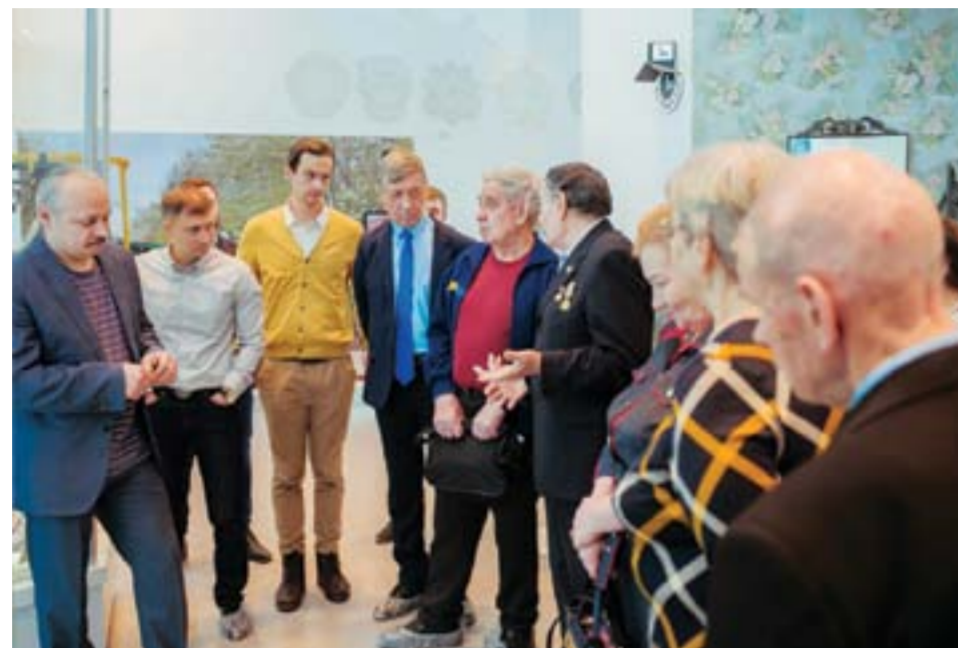
Одно из самых ярких событий минувшего года - встреча с мастерами-ветеранами, которая состоялась в феврале. В будущем Совет мастеров планирует сделать такие мероприятия доброй традицией

В направлении развития системы бережливого производства сформирована рабочая группа из мастеров цехов 2, 7, 71 и 96. Ребята уже прошли курс обучения по БП, причем получили не только «голую теорию», но и смогли применить полученные знания. Практику каждый из них проходил на своем участке: при поддержке специалистов управления 320 они выявляли узкие места и предлагали